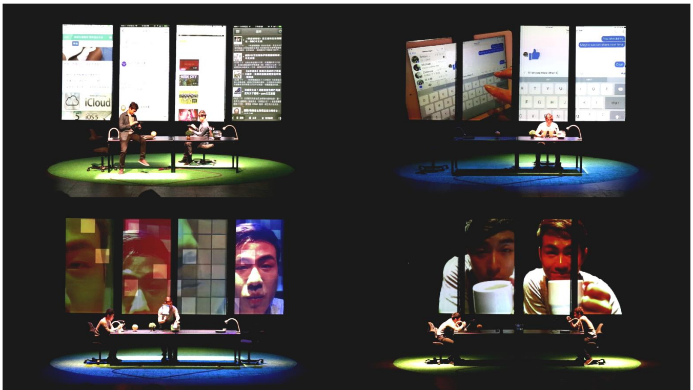
丹麥點擊藝術節演出劇照