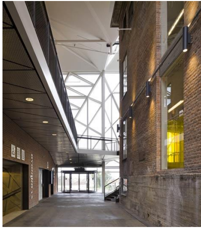
左下：劇場外前臺 / 右下：埃爾西諾 文化庭院