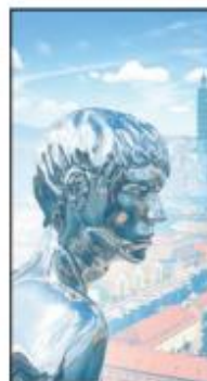
Hvad laver Han der? Der er smagsprøver på en unik 4D-forestilling i værfthallerne på fredag med både taiwanesisk og dansk islet.